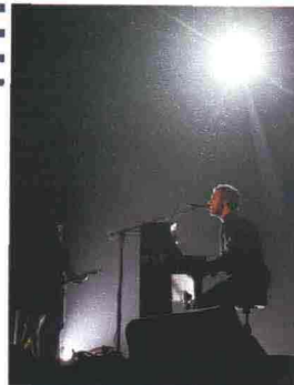
Sopra, dall'alto: Dorble, motore di ricerca per mp3; i Coldplay, che hanno messo gratis la loro ultima canzone su internet. Sotto, gli avatar personalizzabili di Face Your Manga e, in basso, Zopa, sito di prestiti online.

Avete mai provato a cercare una canzone, cioè un file mp3, su un motore di ricerca? I risultati non sono mai soddisfacenti. Un sito che sembra cavarsela bene è Dorble ( www.dorble.com ), una specie di Google della musica. Basta scrivere il nome di un artista o di una canzone e Dorble elenca ciò che è disponibile online. Poi, si può decidere se scaricarlo o ascoltarlo sul momento (in questo caso, un altro sito da provare è songza.com ). Vi fidate solo dei vostri gruppi preferiti? Bene, ormai tante band usano la rete per promuovere i loro dischi: i Nine Inch Nails fanno scaricare gratis il loro nuovo album ( dl.nin.com/theship/signup ), i Coldplay ( coldplay.com/song.html ) e gli Offspring ( www.offspring.com ) stanno facendo altrettanto con i loro ultimi singoli.